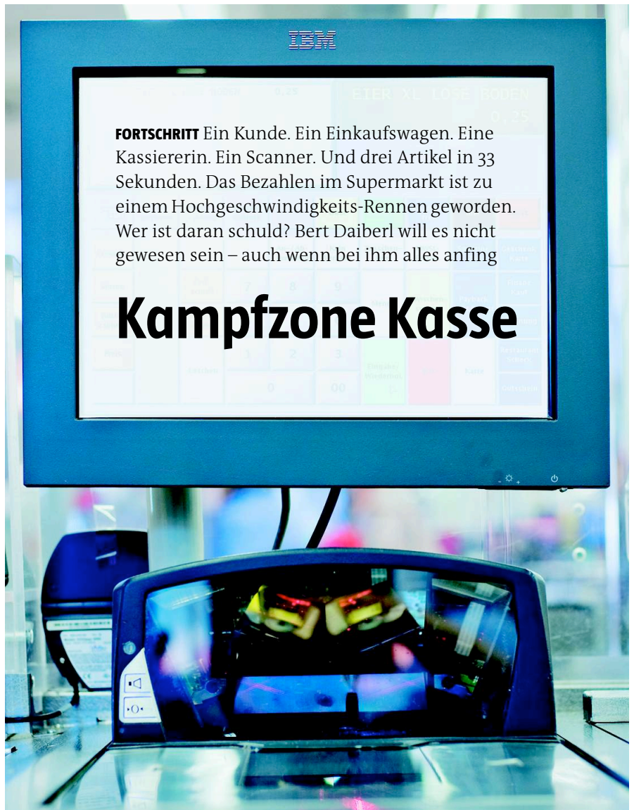
Drei Artikel erfassen und zahlen dauert im Schnitt 33 Sekunden. Scannerkasse im „Real Future Store“ in Tönisvorst am Niederrhein

IBM warb mit seinem Markt. Einzelhändler pilgerten in die Filiale nach Augsburg. Die Hersteller zögerten, Strichcodes auf die Verpackungen zu drucken. Daiberls Leute mussten sie als Etiketten selbst aufkleben. 1982 gab es ganze 66 Scannermärkte in Deutschland. 1985 waren es 719. Nach der Wende stieg die Kurve steil an, Mitte der Neunziger auf über 14.000. Anfangs hatte Daiberl 2 Millionen Umsatz ge-