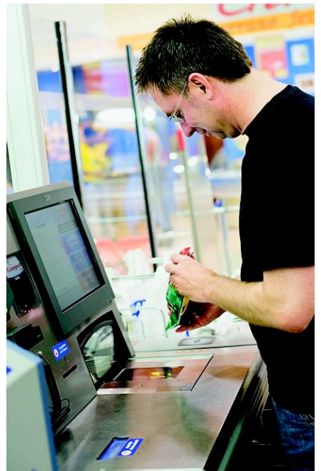
Neues Modell: Kunden scannen. Und die Zukunft? Mikrochips in jeder Ware