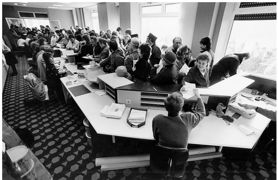
14. November, Westberlin, Dresdner Bank am Schlesischen Tor. DDR-Bürger holen sich je 100 Mark Begrüßungsgeld ab

genehmigte Liste mit den neuen Grenzübergängen bringen lassen. Der Spitzenbeamte wird sie für Walter Momper kopieren und der wird sie dem Außenminister Hans-Dietrich Genscher geben, damit er sie vor dem Schöneberger Rathaus verlesen kann. Die Menschenmenge wird jubeln. In der Nacht zum 11. November werden die Infoblätter gedruckt werden. Die U-Bahnen und S-Bahnen werden fahren, völlig über-