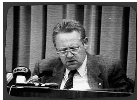
9. November. Schabowski macht es öffentlich: Reisefreiheit

Er hat eine Vorstellung, wie sich Westberlin auf den Ansturm