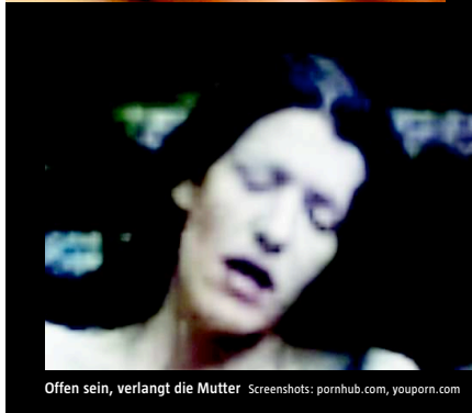
Offen sein, verlangt die Mutter.

Klar habe ich mir die Seiten mal angeguckt. Youporn, redporn, porntube und wie die alle heißen. Teilweise waren da Stellungen und Praktiken dabei, von denen ich überhaupt nicht wusste, was das ist. Keine Ahnung, was die da machen. Ausgerechnet ich, die ich jahrelang über Pornografie recherchiert habe!